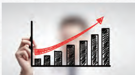
4. 弁理士からのアドバイス 出願戦略のご提案・開発サポート支援