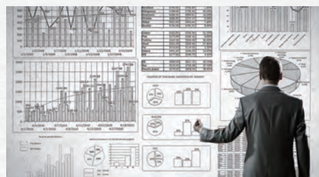
3. 出願動向調査 競合他社の技術動向を分析