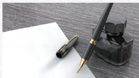
5. 特許出願・権利化 特許庁へ提出する出願書類を作成