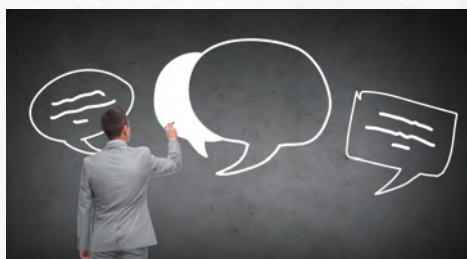
1. ヒアリング 問題点の明確化

私どもでは、出来上がった発明の特許出願を行うだけではなく、 「眠っているアイデア」を「売れる特許」に育てるところからお手伝いいたします。